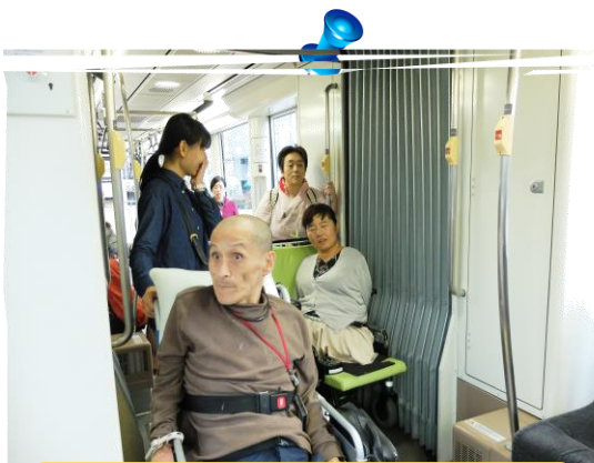
外出実習 市電にて