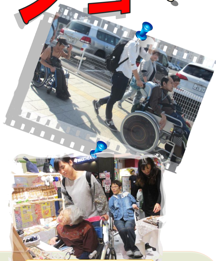
外出実習ショッピング*

一緒に話したり行動する中で、障害者・介助者が高齢者の介護保険とはまた違った自立を学べる研修です。