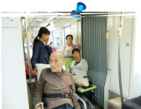
外出実習 市電にて