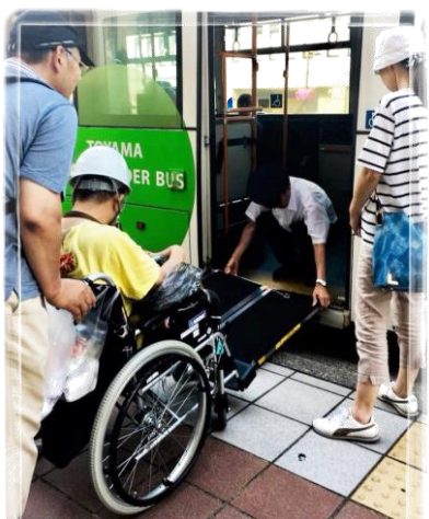
外出実習 路線バス